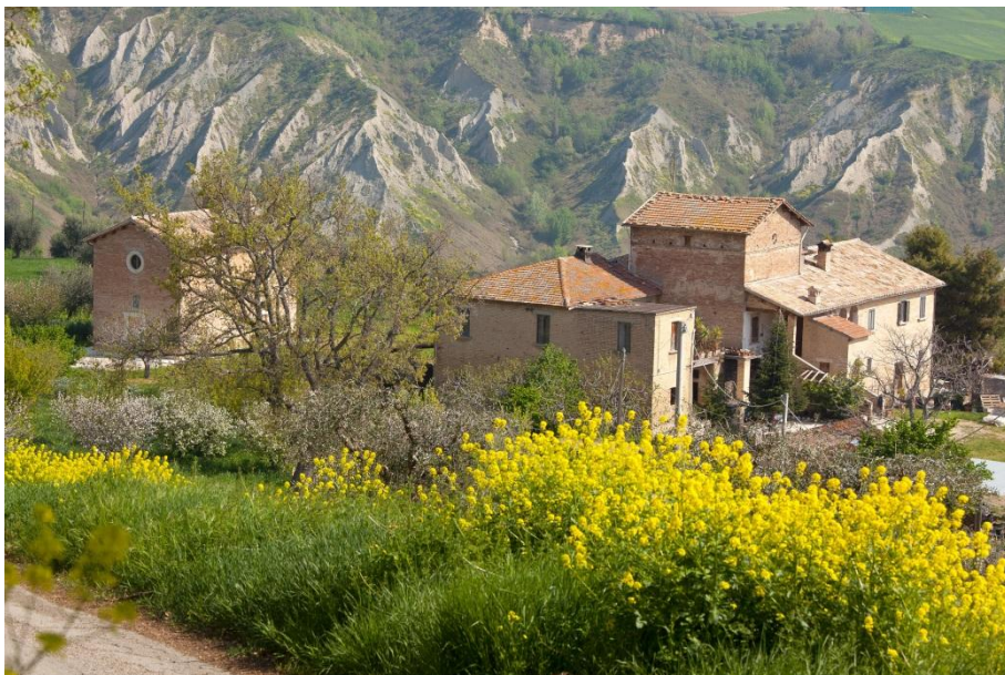
Immagine n. 1 Complesso della proprietà Marucci a Vallechifenti