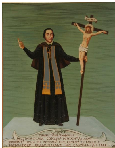
Immagine n. 3, in abito missionario.